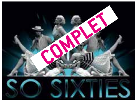
@ So Sixties