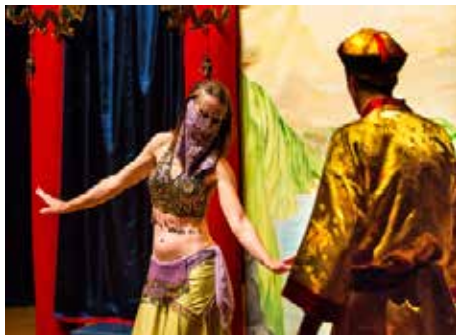
@ Lie Autour de la voix