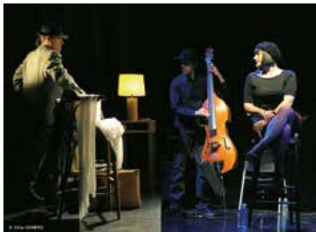
@ Gilles Crampes