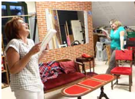
@ Clin d'Oeil